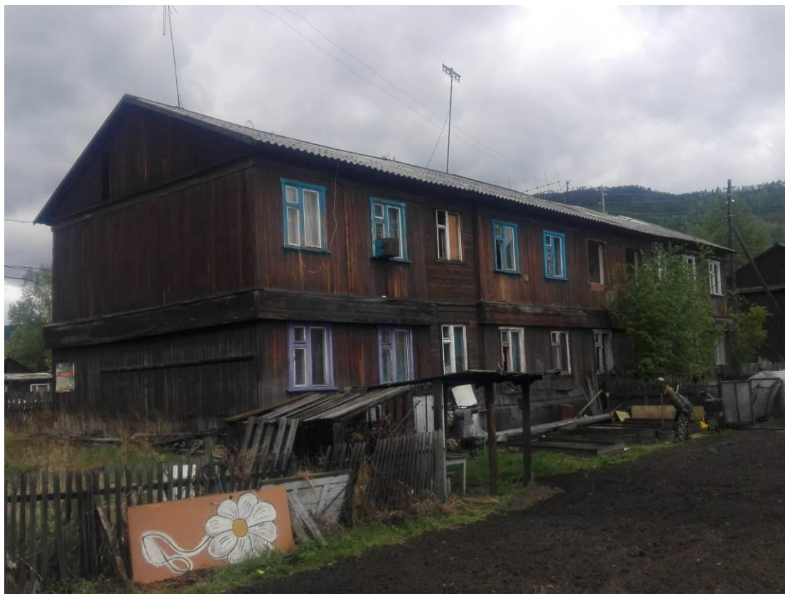
Фото В.1 – Главный фасад