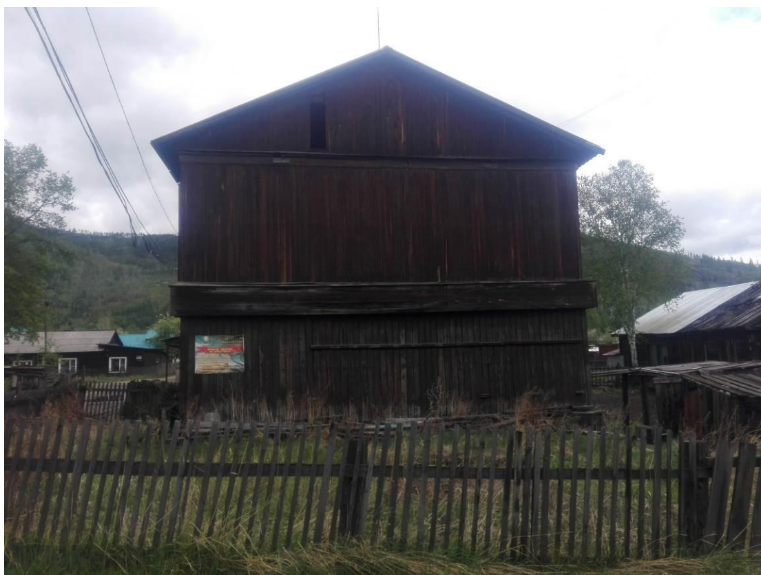
Фото В.2 – Дворовый фасад