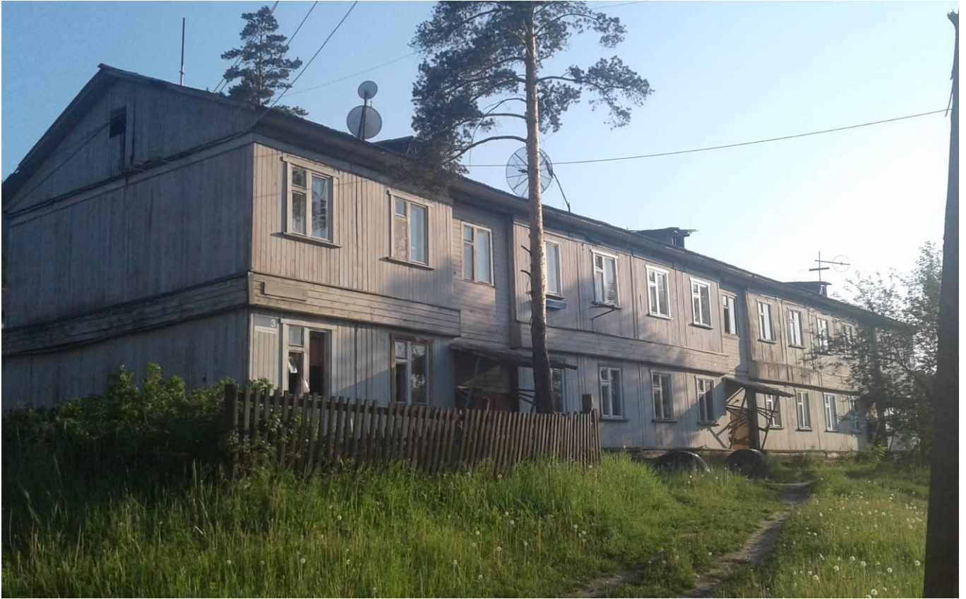
Фото В.1 – Главный фасад