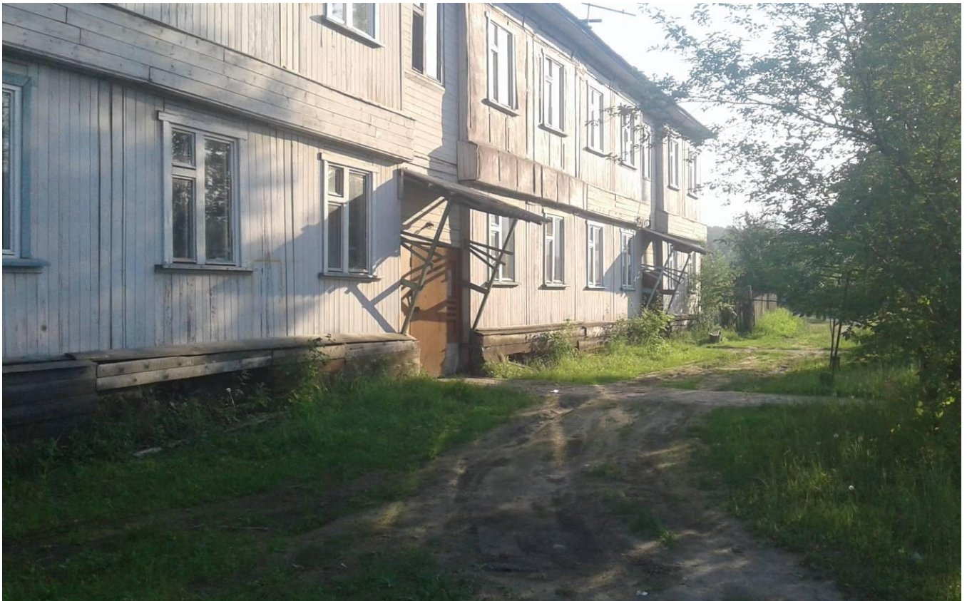
Фото В.2 – Дворовый фасад