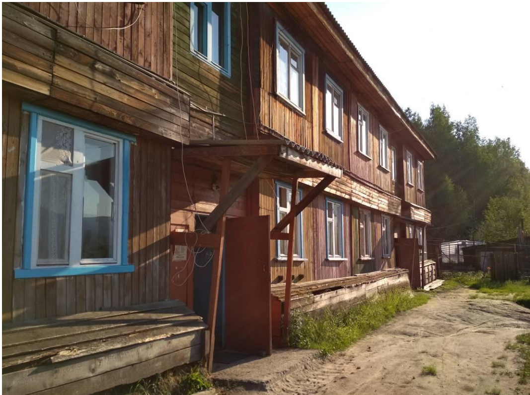
Фото В.2 – Дворовый фасад