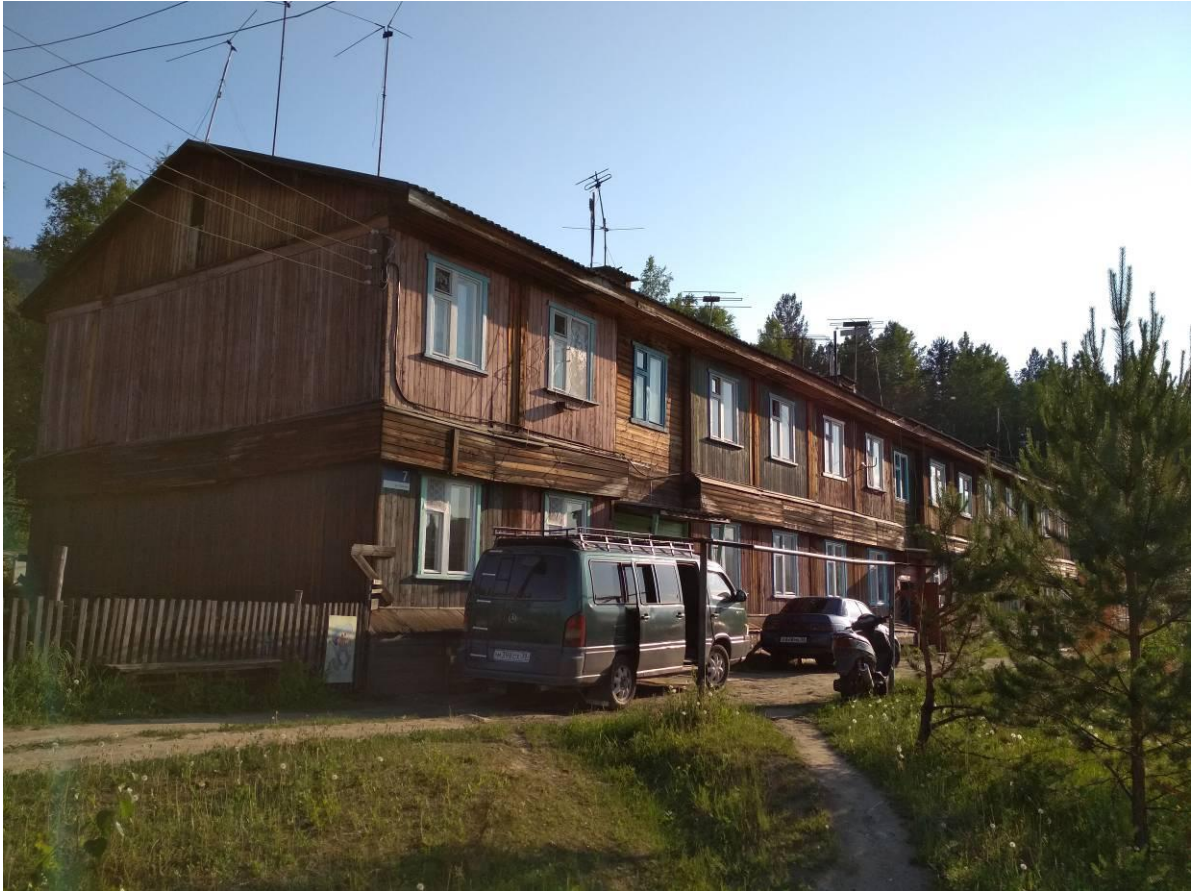
Фото В.1 – Главный фасад